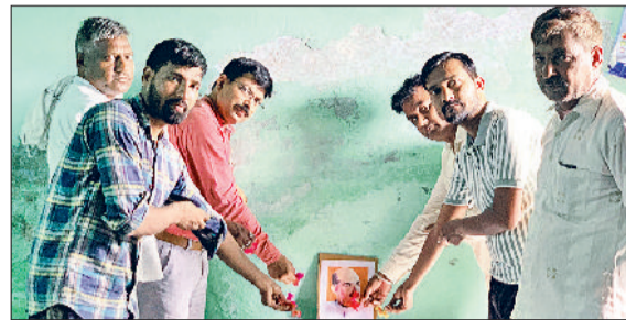
घरौडा। डा. श्यामा प्रसाद मुखर्जी के चित्र पर पुष्प अर्पित करते भाजपाई।

समय में मात्र 2 सांसदों के साथ संसद में प्रवेश किया था और आज यह विश्व की सबसे बड़ी राजनीतिक पार्टी बन चुकी है। कार्यक्रम में पूर्व