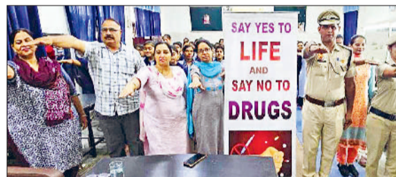
समालखा। आईटीआई में विद्यार्थियों को नशे के खिलाफ शपथ दिलाते हुए।

जीवन में हर वह लक्ष्य पा सकते हैं जिसकी हम कल्पना करते हैं। युवाओं को नशे की गत से बचाने के लिए हरियाणा पुलिस लगातार प्रयासरत है। विद्यार्थी नशे से दूर रहकर पढ़ाई के साथ-साथ खेलों में हिस्सा लेकर जीवन को सवोरो। खेल हमे नशे से दूर रहने के लिए प्रेरित करते है। समाज के अन्य लोगों को भी नशे से दूर रहने बाँरे प्रेरित करें। जिला व गांव को नशा मुक्त