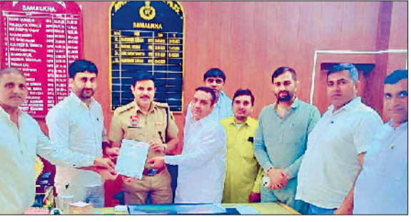
पानीपत। समालखा शहर में चालान प्रक्रिया को लेकर डीएसपी से मिलते सरपंच एसोसिशन सदस्य।