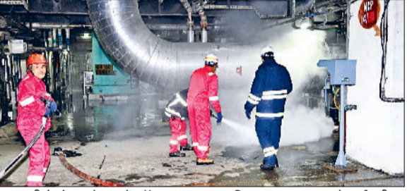
रिफाइनरी के नेपथा क्रैकर में ऑन-साइट आपदा ड्रिल का अभ्यास करते कर्मचारियों।